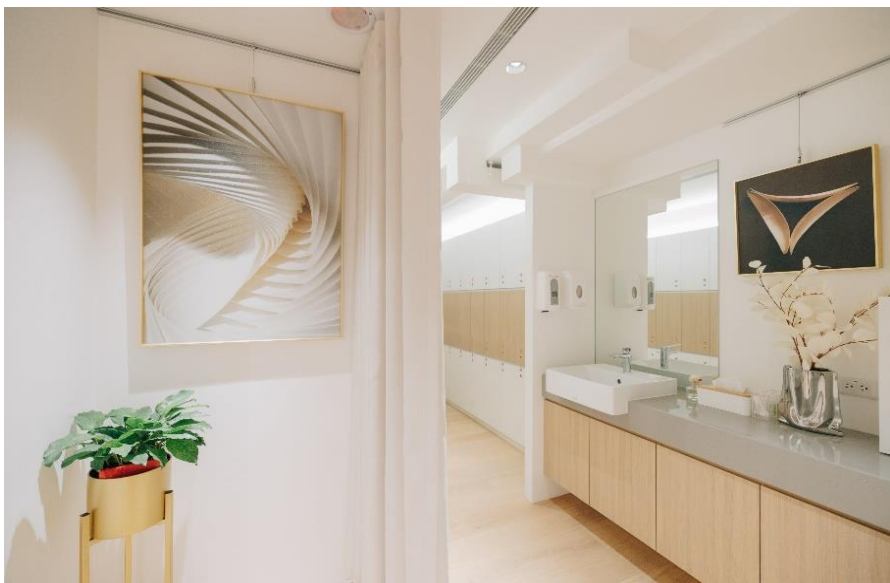
隱私溫馨婦女醫學中心