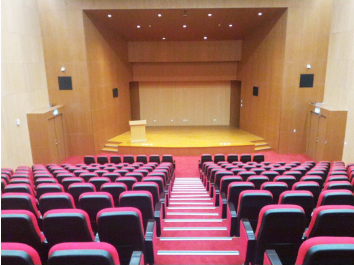
會議空間示意照片